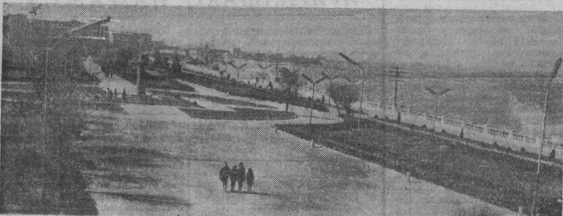
Хороший подарок получили жители Махачкалы. Закончена реконструкция набережной, любимого места отдыха горожан. На снимке: набережная в Махачкале.