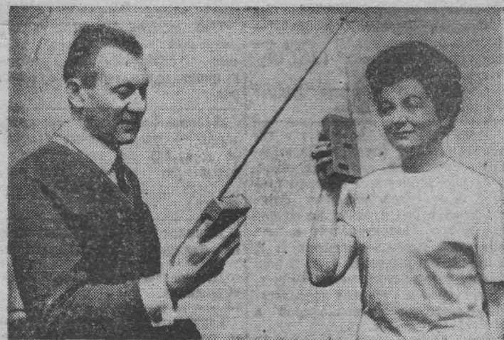
Новый радиотелефон «Эхо» польского производства. Небольшой размер и вес делают его чрезвычайно удобным в употреблении. Дальность работы — 3 километра. Одной батареей хватает на 10 часов непрерывной эксплуатации.