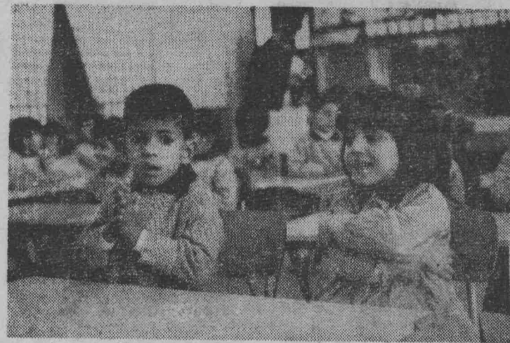
КУБИТ. Семь лет назад страна обрега независимость, полужив конец многолетнему английскому владычеству.

С первых дней самостоятельного развития молодое государство обращает большое внимание на воспитание подрастающего поколения. В стране открыто несколько десятков детских садов — невольничья роскошь в колониальные времена.