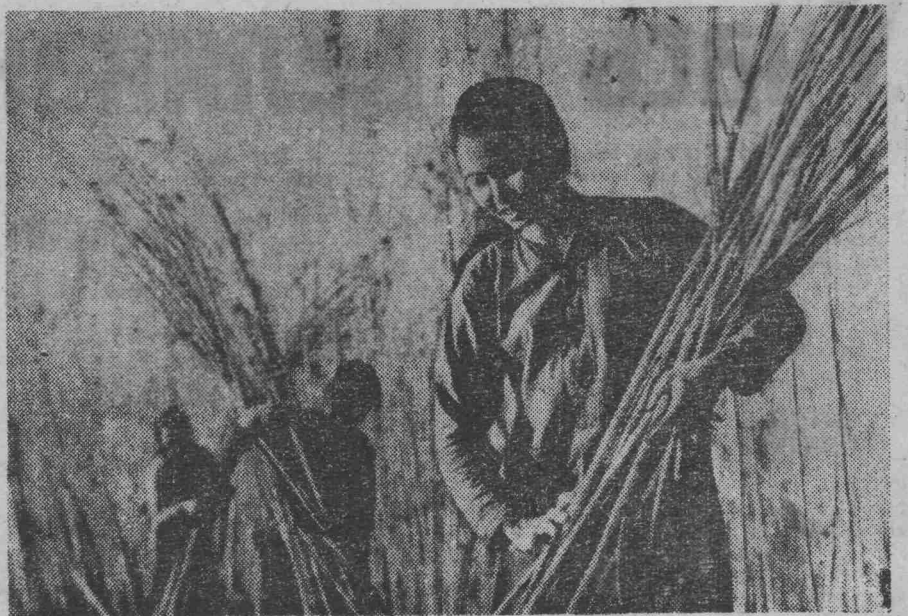
ДЕМОКРАТИЧЕСКАЯ РЕСПУБЛИКА ВЬЕТНАМ. Крестьяне на плантации джута в кооперативе Фу Чу (провинция Тхайбинь).

Выборы были сфальсифицированы деголлевскими властями, которые «сделали ставку на шантаж, страх и гражданскую войну», — заявил член Политбюро Французской коммунистической партии Ж. Марше. В результате выборы стали «завершением широкого заговора, организованного деголлевской партией». «Коммунистическая партия будет продолжать свою традиционную политику — защищать требования рабочего класса и крестьянства. В политическом плане мы будем продолжать утверждать, что не существует демократического исхода вне союза рабочих и демократических сил». (ТАСС).