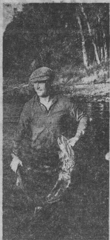
ХАБАРОВСКИЙ КРАЙ. Хор — река лесозаготовителей. Но по ней не только сплавляется древесина. В свободное от работы время лесорубы любят побороться спиннинг. И такая удача — не редкость.

По обсуждаемому вопросу пленум принял развернутое решение. На пленуме были утверждены мероприятия по достойной встрече 100-летия со дня рождения Владимира Ильича Ленина.