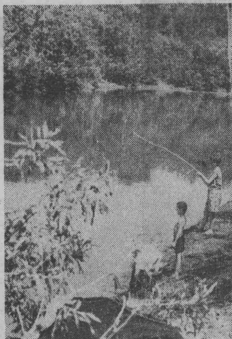
На рыбалке.

На следующий день, 6 июля, с 5 часов вечера — матч сборных юношеских команд Ленинска и Кемерова.