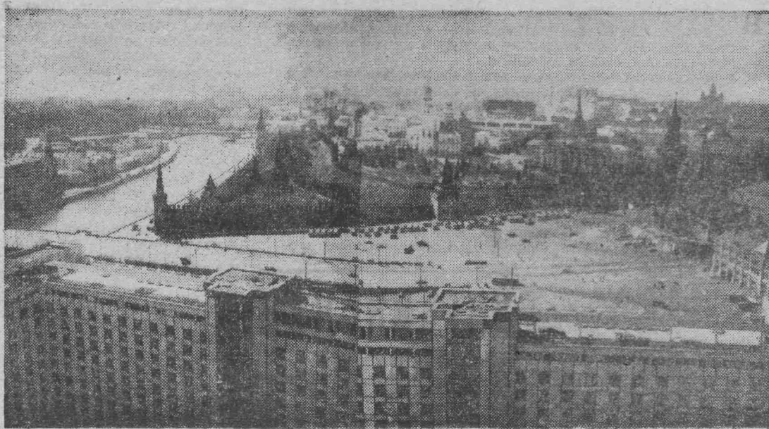
Москва сегодня. Вид на Кремль с гостиницы «Россия».