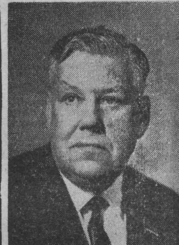
Исполнилось 70 лет писателю Соболеву Леониду Сергеевичу.