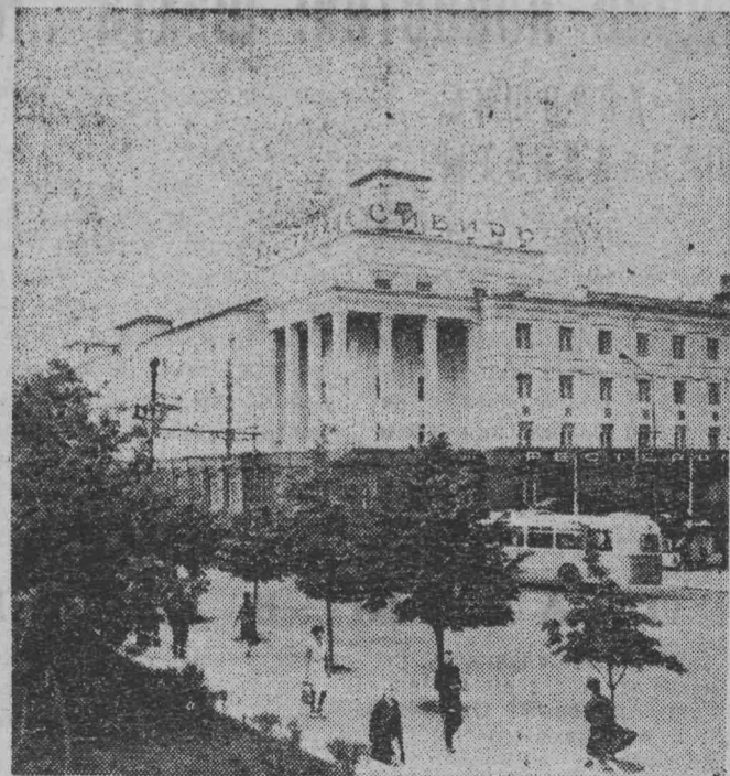
Красивые скверы, парки и сады украшают город Омск. К 1980 году на каждого горожанина будет приходиться 24 квадратных метра зеленых насаждений. В Омске установилась хорошая традиция — горожане участвуют в разбивке скверов, сажают здесь деревья, цветы.

И еще одна особенность. В летний период будет решен и такой вопрос, как обеспечение цеха сжатым воздухом. Для этого будет смонтирован компрессор.