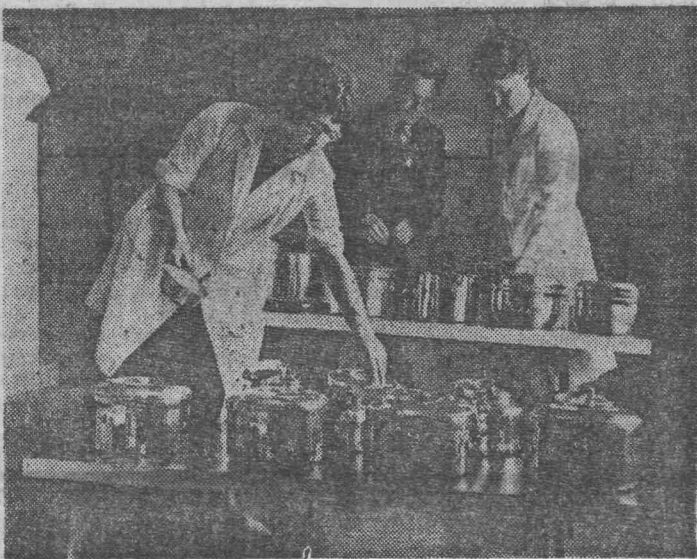
СВЕРДЛОВСКАЯ ОБЛАСТЬ. Семьдесят видов продукции широкого потребления выпускает Каменск-Уральский металлургический завод: чайники, кастрюли, снаряжение для туристов и многое другое. Все эти изделия охотно покупают не только жители нашей страны, но и дружественных нам государств.

Наш дом № 39 по ул. Калинина в прошлом году был на капитальном ремонте с июня по октябрь включительно. Дом отремонтировали, а подъ-