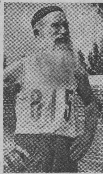
ВОРОНЕЖ. На беговой дорожке среди молодежи, готовящейся к соревнованиям, не часто встретишь человека в 75-летнем возрасте.