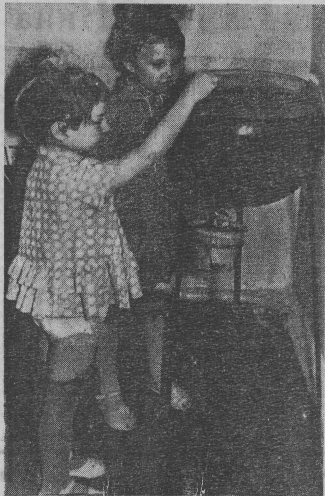
На снимке: в детском садике № 12 Соцгородка. Дети горняков шахты «Польсаевская-2» здесь всегда окружены душевной заботой воспитателей.