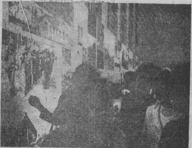
СОФИЯ. Деlegation Лаоса открыла здесь выставку, рассказывающую о борьбе лаотийского народа против агрессии США. На снимке: посетители осматривают экспозицию.