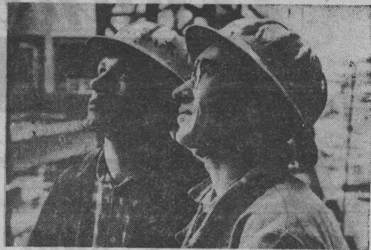
Записб строится. Сейчас объектом номер один считается кислородно-конверторный цех. Строители взяли обязательство закончить его к юбилею комсомола.