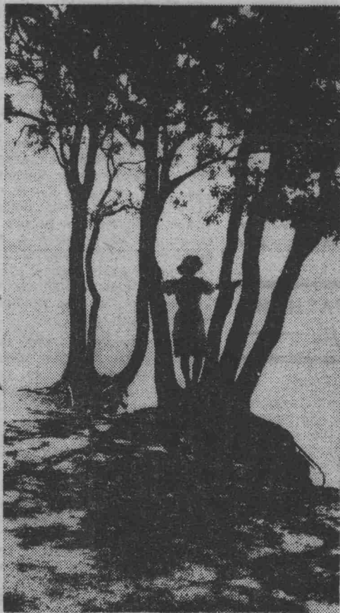
Над Томью широкой