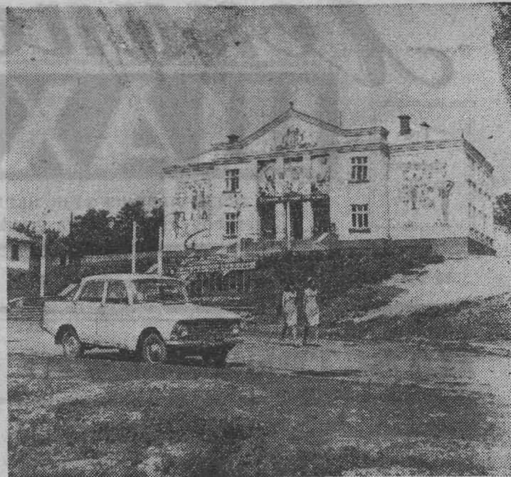
МОЛДАВСКАЯ ССР. Большое строительство культурно-бытовых и жилых зданий ведется в колхозе имени Ленина Котовского района. Сданы в эксплуатацию детские ясли-сад, Дом культуры, клуб, школа. Только за последние три года сельхозартель израсходовала на строительство около миллиона рублей.

Однако при организации проверок не все было внимательно продумано. Бюро группы не организовало сбор предложений трудящихся. Материалы рейдов не освещались в стенной печати, неудовлетворительно ведется документация. На эти и другие недостатки указал городской комитет народного контроля, обсуждая отчет председателя группы народного контроля.