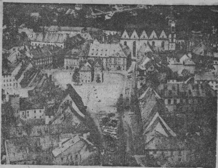
Так выглядит сверху древний чешский город Хеб. Он возник на месте славянского поселения, существовавшего еще в доисторическую эпоху.

Заявки на участие в финальных соревнованиях вместе с отчетом о проведении соревнований в коллективе физкультуры подаются на заседание судейской коллегии, которое состоится 13 февраля в 16 часов в помещении горвоенкомата.