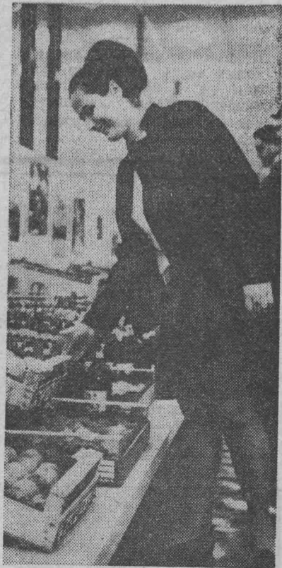
Традиционная выставка вин и плодов открылась в венгерском городе Сегеде. В ее экспозиции — вина более 100 марок.

Струйный способ вдвое дешевле помола в шаровых мельницах. В каждой области струйную мельницу и смеситель можно изготовить своими силами в обычной механической мастерской. Себестоимость извести — основного сырья — уменьшается вдвое.