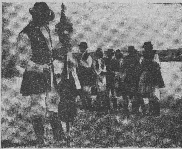
ПОЛЬША. Такой оригинальный струнный инструмент вряд ли встретишь в профессиональном оркестре. А к северу от Гданьска, в так называемом Кошубском погорье, без него не обходится ни один праздник.

БРЮССЕЛЬ (ТАСС). Пленум ЦК Компартии Бельгии избрал председателем партии Марка Дрюмо, который исполнял обязанности председателя после кончины Э. Бюрнелля.