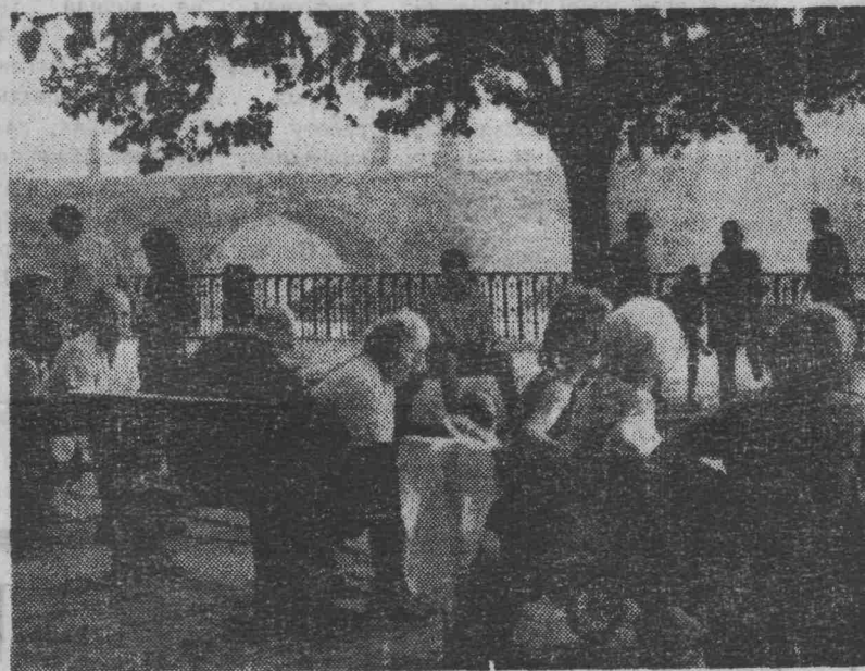
ПРАГА СЕГОДНЯ. На набережной Влтавы.

В. ХОДОНОВИЧ, общественный корреспондент газеты «Советская Россия» по городу Ленинск-Кузнецкому.