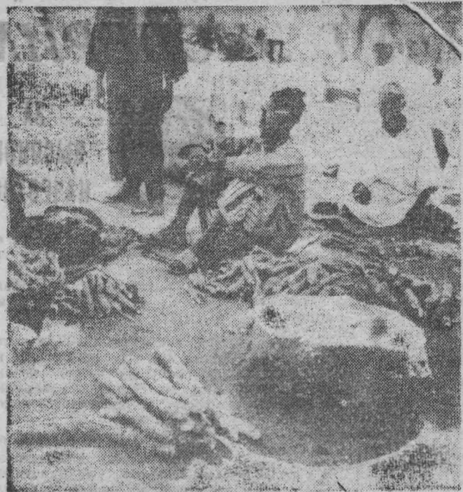
ВЕРХНЯЯ ВОЛЬТА. Апельсины, манго, мандарины, мангока, фонно, помидоры, орехи «кола»... Чего только не родит благодатная африканская почва.

На снимке: продавцы мангоки. Эти сладкие корни употребляют в пищу, предварительно очистив от серой корки. Из мангоки делают муку — таниоку.