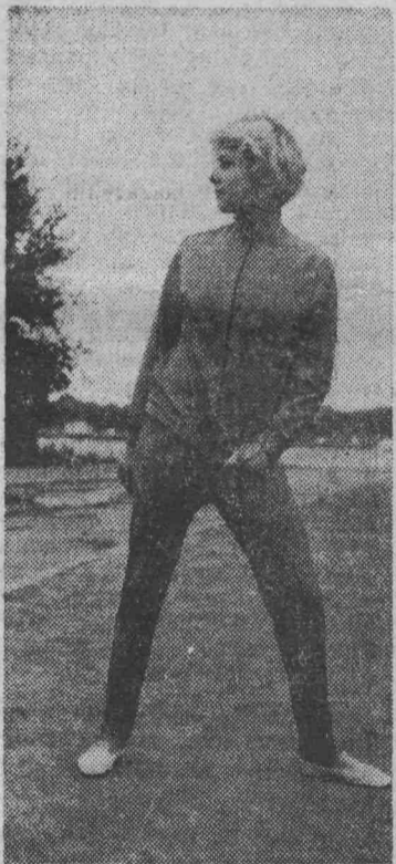
Тренировочный костюм советских спортсменов-гимнастов — участников XIX Олимпийских игр в Мексике.