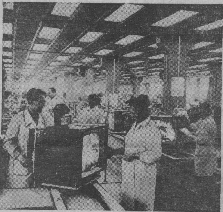
На Московском телевизионном заводе началось серийное производство телевизионных приемников «Рубин-401». Приемник рассчитан для приема цветного изображения.