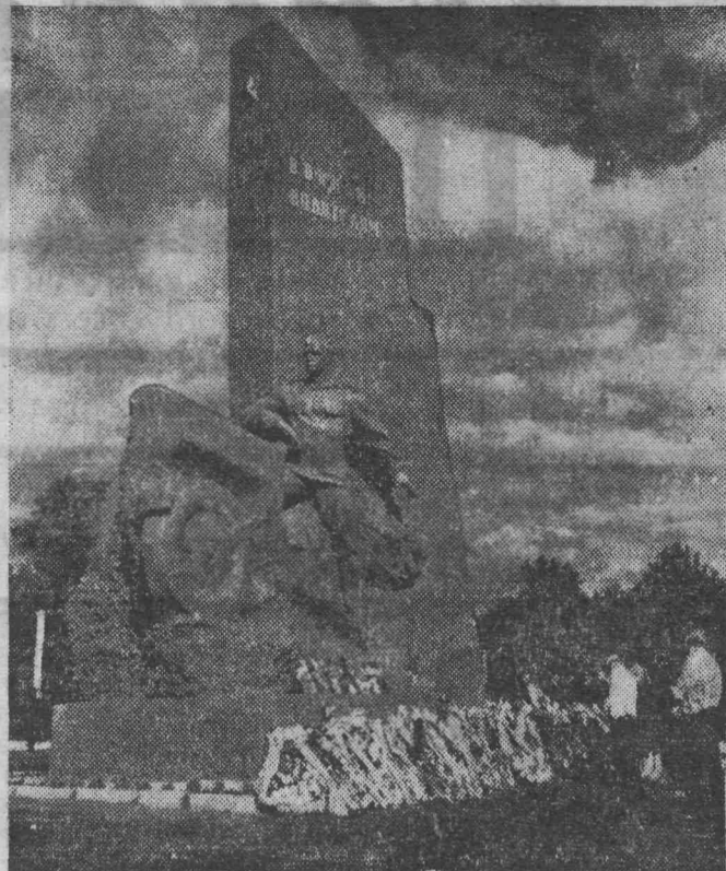
БРЯНСКАЯ ОБЛАСТЬ. В пяти километрах от Брянска около автомагистрали, ведущей в г. Орел, открыт памятник воинам-водителям, павшим на дорогах Великой Отечественной войны. Он изготовлен по проекту скульптора лауреата Государственной премии П. Ф. Мовчуна.