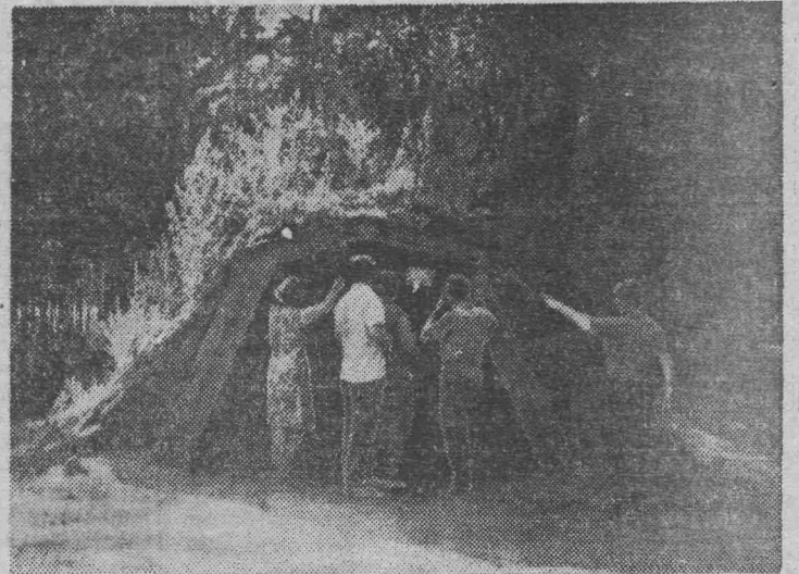
Шалаш на берегу озера Перово в Шушенском. Здесь Ленин отдыхал во время охоты.

Е. ФОМИНА, старший инспектор паспортного отделения ГОМ.