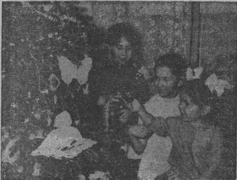
Как улыбки, сверкают игрушки... Что купила заботливо мать, Веселится у елки, девочки, Только — цур! — Новый год не проспять!