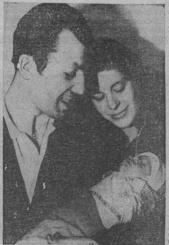
Расти, малышка! Расти, Олечка, Как травы, — буйно, как дуб, — упрямо, Тебе опора, тебе поддержка Улыбка папы, улыбка мамы.