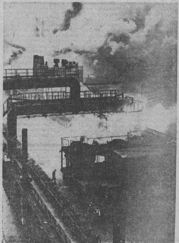
Новотроицк. В этом году на Орско-Халиловском металлургическом комбинате начала выдавать продукцию большая коксовая батарея № 5. Поддержав почти записовцев, коксохимники Новотроицка досрочно освоили и перекрыли проектную мощность батареи, на тридцать минут сократили процесс коксования. Это ежегодно позволит давать более тысячи тонн кокса сверх плана.

На снимке: загрузка коксовой батареи № 5.