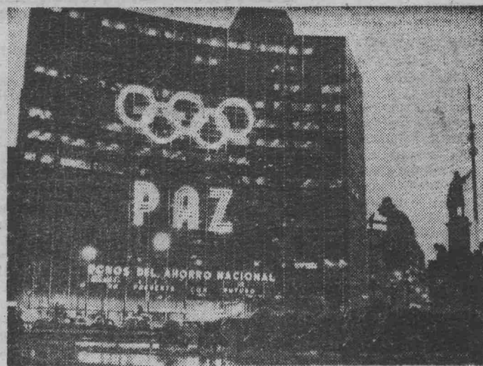
Мехико. Столица Мексики готовится к Олимпиаде. Ее эмблему — пять переплетенных колец, можно увидеть везде — на фронтонах зданий, на товарах и даже на номерах автомашины.