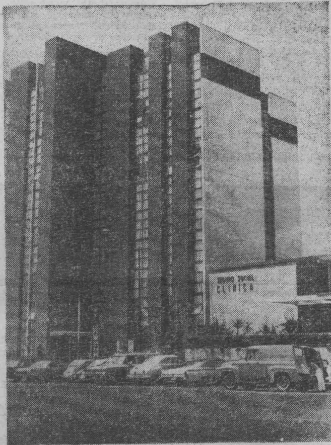
МЕХИКО. Олимпийская деревня. На снимке: десятиэтажный дом, в котором размещается советская спортивная делегация.