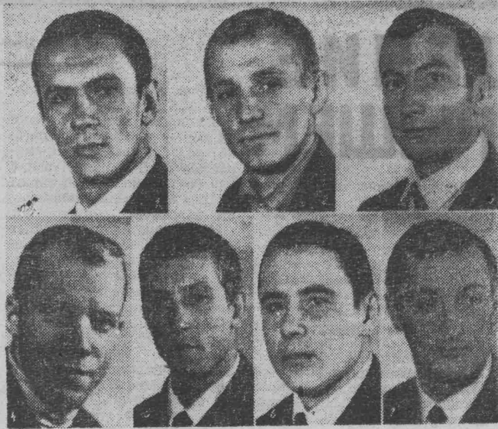
Сборная олимпийская команда СССР по гимнастике (мужчины): 1) Михаил Воронин, 2) Сергей Дюмидов, 3) Виктор Лисицкий, 4) Валерий Карасев, 5) Виктор Клименко, 6) Валерий Ильичин, 7) Владимир Социн.