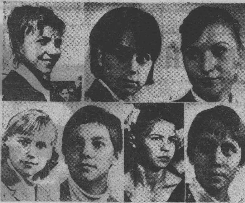
Сборная олимпийская команда СССР по гимнастике (женщины): 1) Наталья Кучинская, 2) Зинаида Воронина, 3) Лариса Петрик, 4) Ольга Карасева, 5) Любовь Бурда, 6) Людмила Турищева, 7) Тамара Лазакович.

В пятый раз выходит на олимпийское ристалище советская команда. Наши спортсмены, а их более четырехсот, участвуют в состязаниях по всем видам программы, кроме футбола и травяного хоккея. 13 октября был первым рабочим днем Олимпиады.