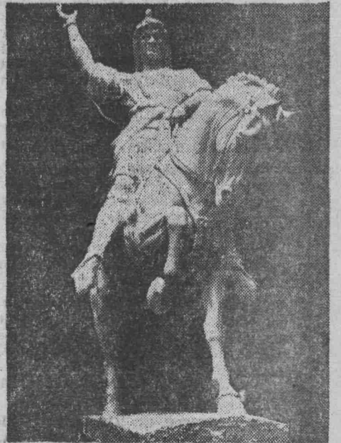
В Москве открылась выставка произведений, удостоенных медалей Академии художеств СССР.