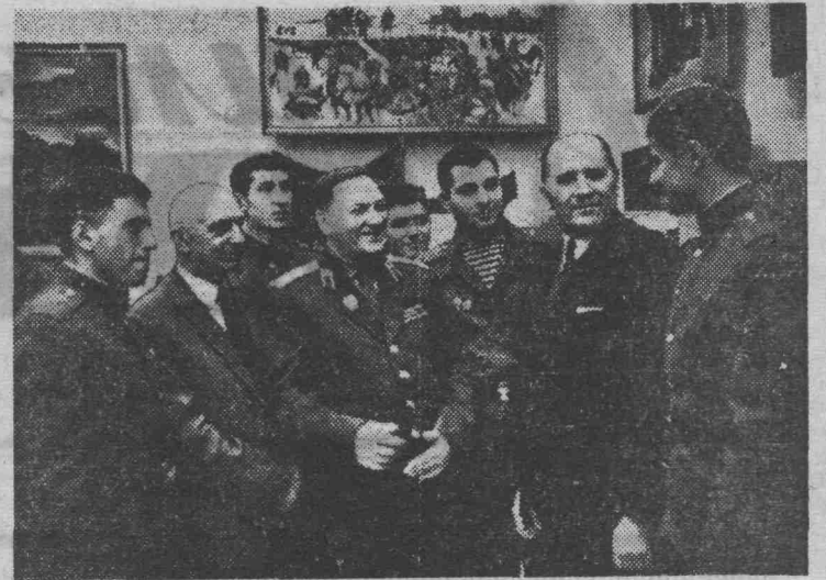
МОСКВА. В Центральном музее Вооруженных Сил СССР открылась выставка «Ленинский комсомол в боях за Родину», посвященная 50-летию ВЛКСМ.

На снимке (слева направо): комсомольцы 20-х годов среди молодых солдат — посетителей выставки.