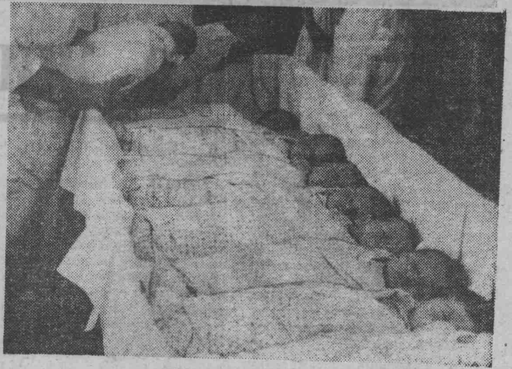
После сытного обеда не мешает и вздремнуть.

Это право он завоевал после отличного выступления в первенстве области. В Красноярске А. Игнатов занял шестое место.