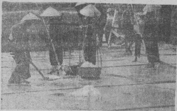
В условиях военного времени население ДРВ мобилизует все силы на обеспечение страны продуктами питания. Тяжел труд крестьян, добывающих соль из морской воды. Община Куньхуан в провинции Нгеан в этом году сдала государству 9 тысяч тонн соли. На снимке: трудовой день в Куньхуан.