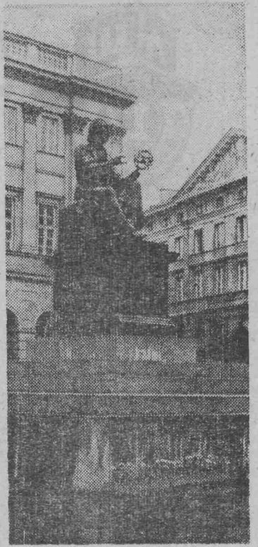
Памятник великому польскому астроному Николаю Копернику в Варшаве.