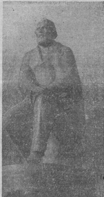
Памятник И. С. Тургеневу, открытый к 150-летию со дня рождения писателя на его родине в гор. Орле.