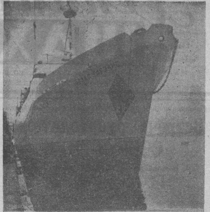
ЛИТОВСКАЯ ССР. На Клайпедском судостроительном заводе «Балтия» спущен на воду новый большой морозильный рыболовный траулер, названный именем выдающегося революционера, бывшего секретаря ЦК КП Литвы. Юозаса Гарялиса. На БМРТ «Юозас Гарялис» установлен чехословацкий двигатель мощностью в 2.500 лошадиных сил. Траулер построен для Клайпедского тралового флота.