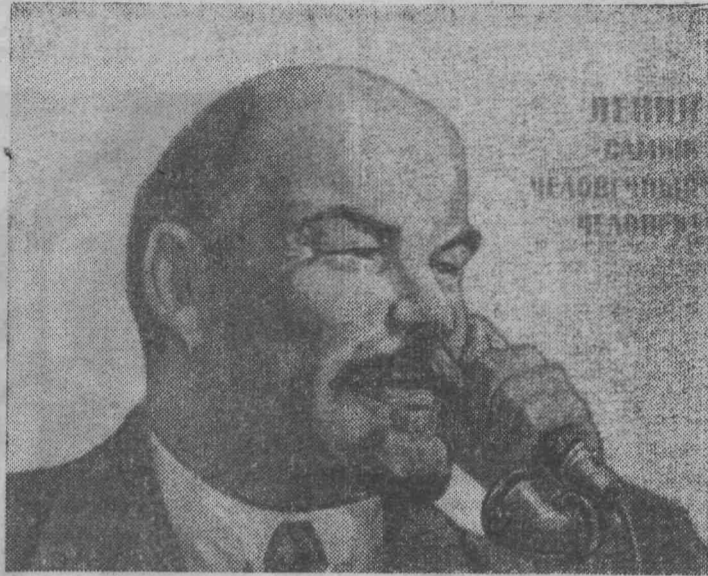
Москва. Плакат художника В. Иванова «Ленин—самый человечный человек». Экспонируется на выставке «Издательство «Советский художник» к 100-летию со дня рождения В. И. Ленина», открытой в Комитете по печати при Совете Министров СССР.