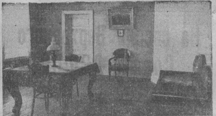
На снимке: комната в доме-музее «Искры» в Пскове, где происходило нелегальное совещание русских социал-демократов по вопросу создания газеты «Искра» и журнала «Заря» под руководством В. И. Ленина.

Владимир Ильич крайне болезненно относился ко всякой размовке с Плехановым, не спал ночи, нервничал. А Плеханов сердился, дулся.