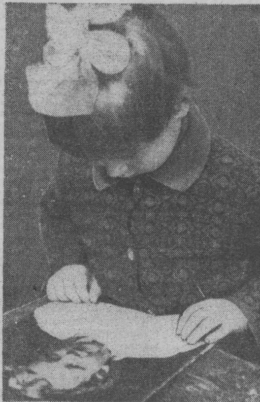
ПЕРВОЕ ЗНАКОМСТВО