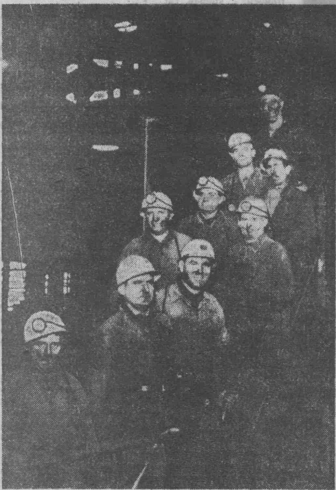
На снимке: делегация советских горняков с французскими угольщиками на шах-

Скажем, техника безопасности. Коренные выработки закреплены металлической арочной крепью и затянuty проволокой (0,5 — 0,6 см.) редкими ячейками в 20 — 25 см., сквозь которые там и тут проглядываются неза-