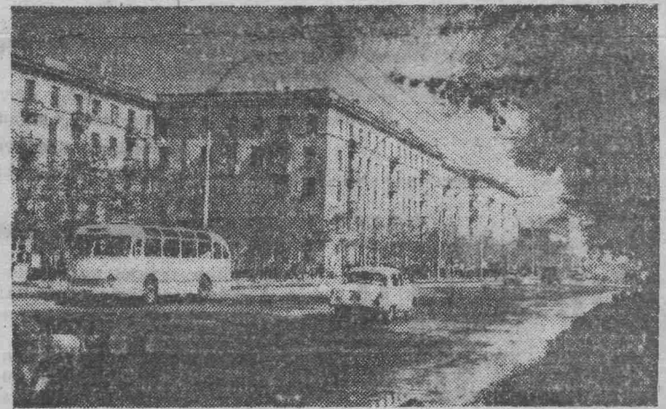
КИШИНЕВ, Проспект Ленина.