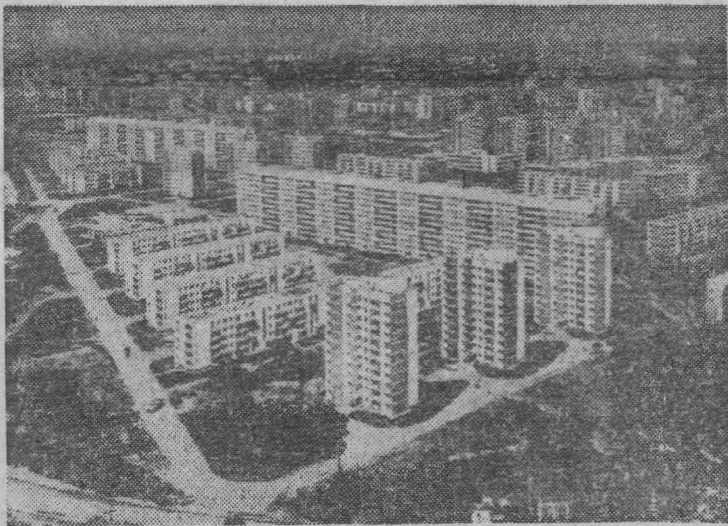
Социалистическая Республика Румыния. Бухарест. Новые жилые дома в районе Милитарь.