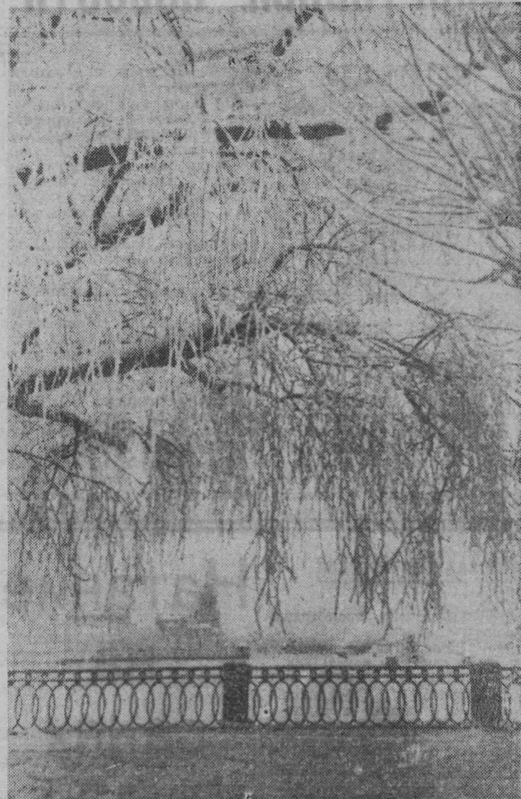
Прекрасен в эти морозные дни старинный город Выборг.