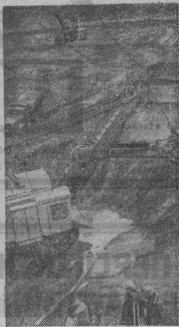
На снимке: разработка грунта на строительстве Нижне-Камской ГЭС.