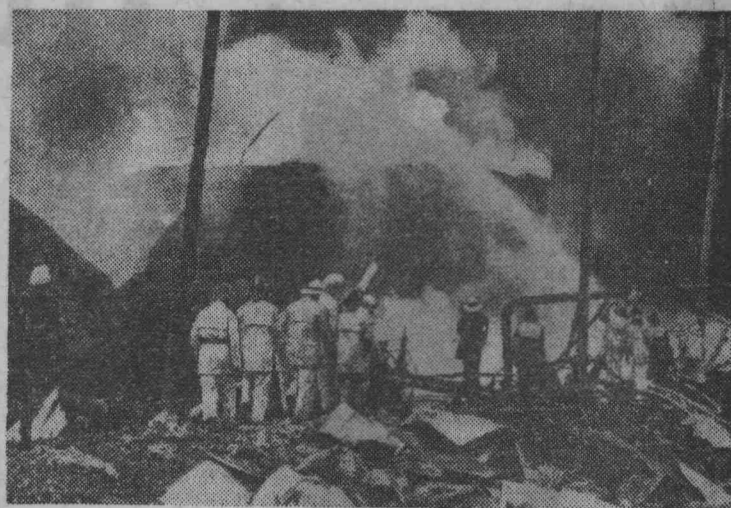
РОТТЕРДАМ. На нефтехранилищах компании Шелл, расположенных в крупнейшем порту Нидерландов, произошел сильный взрыв и пожар. Убытки исчисляются суммой в несколько миллионов голландских гульденов. На снимке: во время пожара.