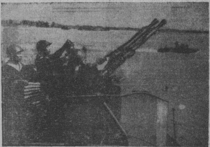
Демократическая Республика Вьетнам. Защитники Хайфона патрулируют побережье около города.