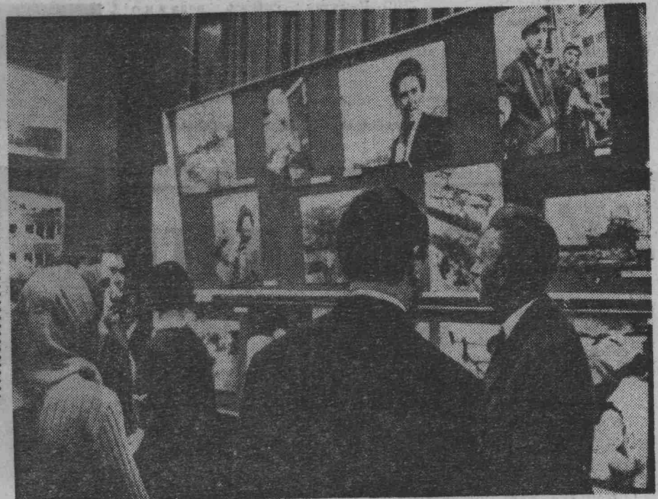
Редактор А. И. ЛАКИСОВ.