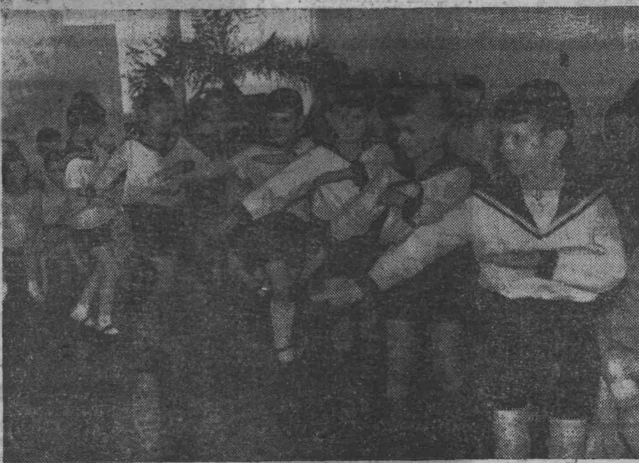
Хорошо встретили праздник весны дети детского сада № 9. Им было чем порадовать своих мам. Дети плясали и пели песни, декламировали стихи, танцевали. И мамы были очень довольны.