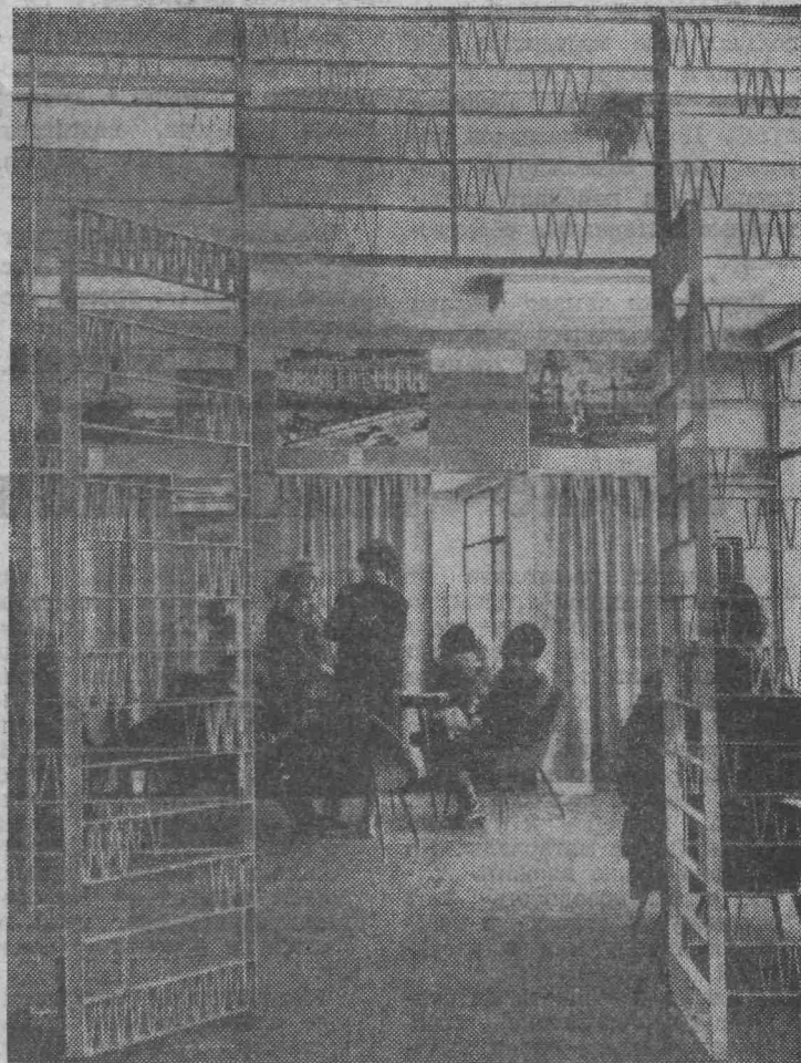
ЛЕНИНГРАД. Открылся один из крупнейших в городе Нарвский дом бытовых услуг. Полезная площадь этого предприятия 6 тысяч квадратных метров. Здесь оказывают 22 вида услуг: производят химчистку одежды, ремонтируют обувь, часы, фотоаппараты и многие другие бытовые приборы. Парикмахерский салон дома имеет дамский, мужской и детский залы, работают ателье прората, стол заказов и т. д.

Подсчитано, что ежедневно дом бытовых услуг посещает от 8 до 10 тысяч человек, но в помещении нет ни духоты, ни суеты. Мощные кондиционеры очищают воздух, а 8 скоростных лифтов быстро развозят посетителей по этажам.