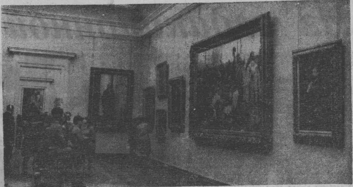
СЕМЬ ДЕСЯТИЛЕТИЙ РУССКОГО МУЗЕЯ

На снимке: в зале картин художника И. Е. Репина.