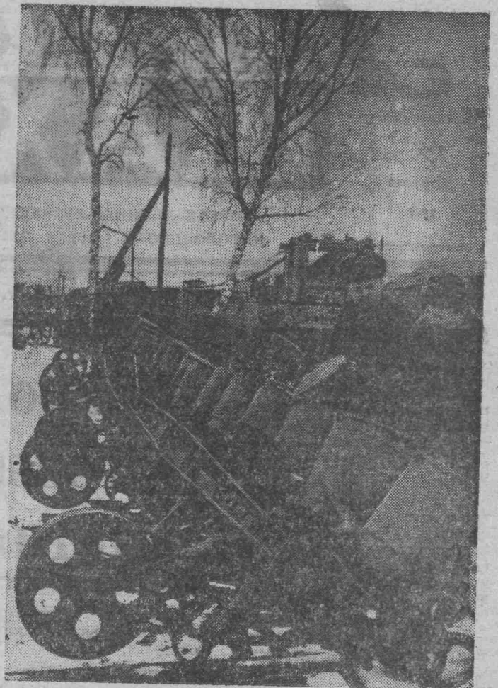
Коллектив механизаторов совхоза «Забойщик» Кеморовского района, подхватив почин Юргинского отделения «Сельхозтехники», обязался досрочно отремонтировать посевную и почвообрабатывающую технику.

Н. ФРОЛОВ, председатель группы народного контроля завода полукосования.