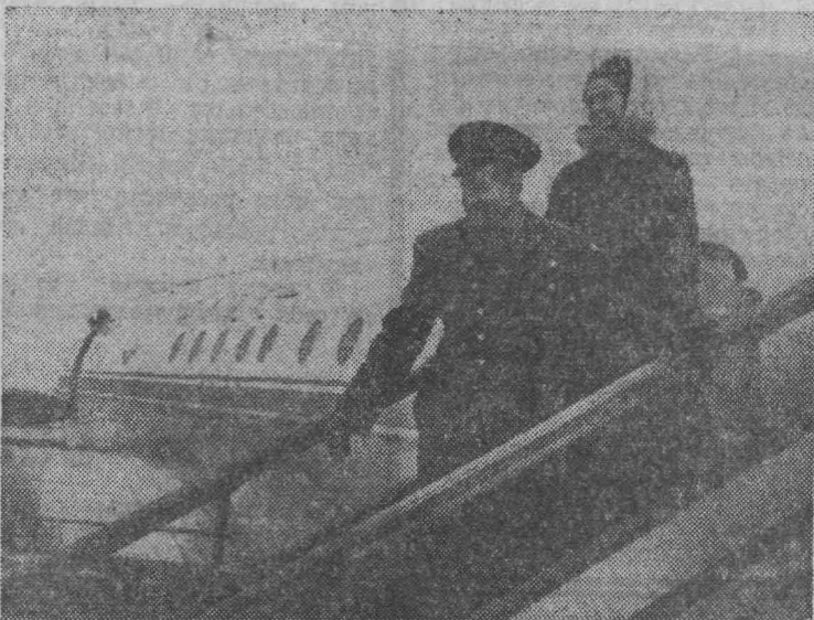
Этот снимок уже вошел в историю. Кузбассовцы хорошо помнят тот день, когда гостем у труженников земли Кузнецкой был наш земляк, летчик-космонавт, Герой Советского Союза Алексей Архипович Леонов.

Первым к столу государственной экзаменационной комиссии подошел полковник Алексей Архипович Леонов. Три года назад перед другой комиссией он так же четко докладывал о готовности к космическому полету и проведению уникального эксперимента — выходу из кос-