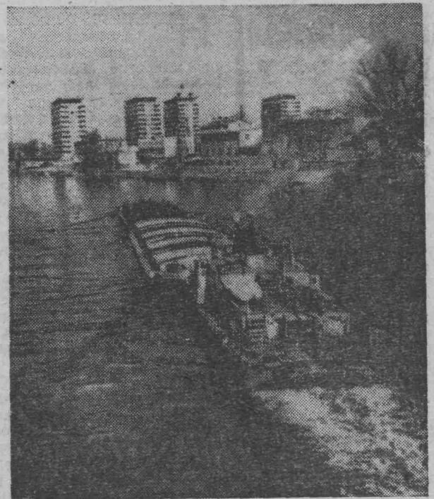
Необычно рано очистилась ото льда на территории Польши и Чехословакии одна из важнейших водных артерий Европы река Одра (Одер). Это позволило речникам двух братских стран на несколько недель раньше срока начать навигацию.