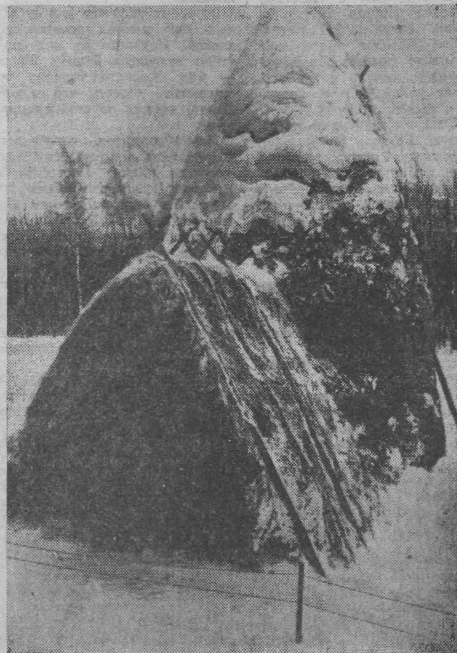
В этом пещере у озера Разлив в июле-августе 1917 года Владимир Ильич Ленин скрывался от преследования ищек контрреволюционного буржуазного Временного правительства. Отсюда В. И. Ленин руководил большевистской партией, готовил ее к вооруженному восстанию.