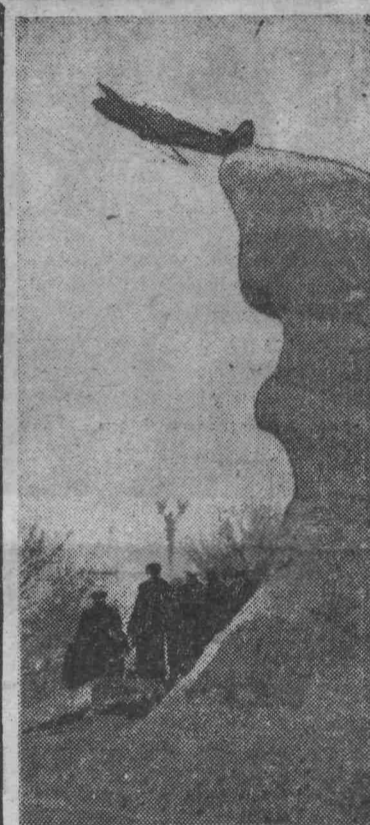
СЕВАСТОПОЛЬ. Памятник отважным летчикам, павшим в боях за освобождение Крыма и Севастополя от фашистских оккупантов.