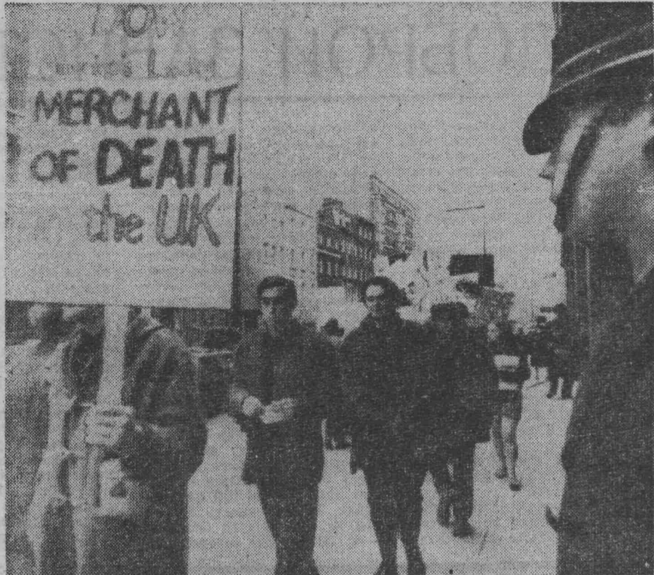
В Лондоне у здания американской компании «Доу кемикл» состоялась демонстрация протеста англичан против применения во Вьетнаме напалма, производимого этой компанией. Плакат гласит: «Доу — американский торговец смертью в Великобритании».